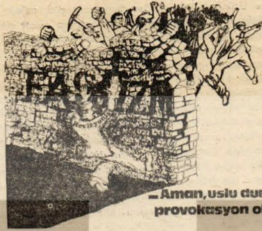
— Aman, uslu durun, provokasyon olur !

Revizyonistlerin «provokasyon» teorisini, süslemek için kullandıkları diğer bir mesele örgütlenmedir. Bugün her seviyede örgütlenmek halkımızın ve proletaryanın en önemli meselesidir. An-